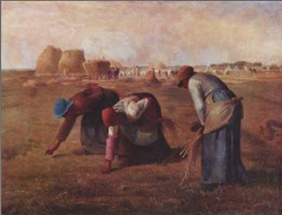
GUSTAVE COURBET: Las espigadoras