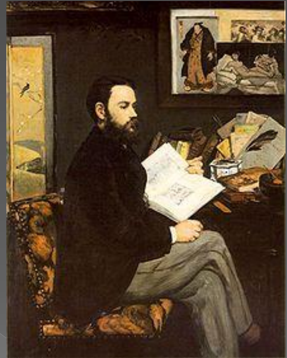
EDOUARD MANET: Émile Zola