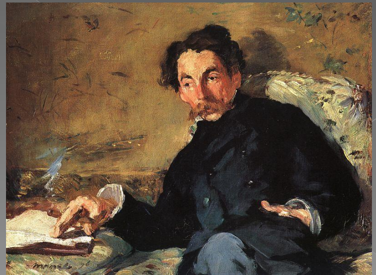
EDOUARD MANET: Retrato de Stéphane Mallarmé