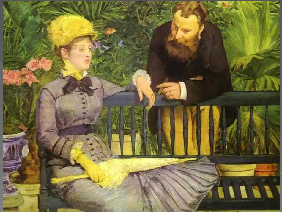
EDOUARD MANET: El conservatorio