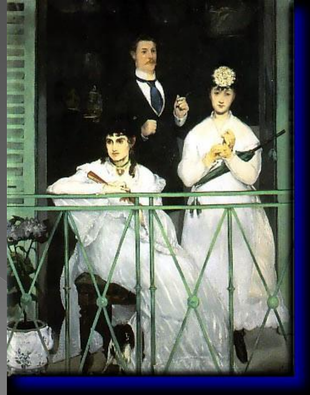
EDOUARD MANET: El balcón